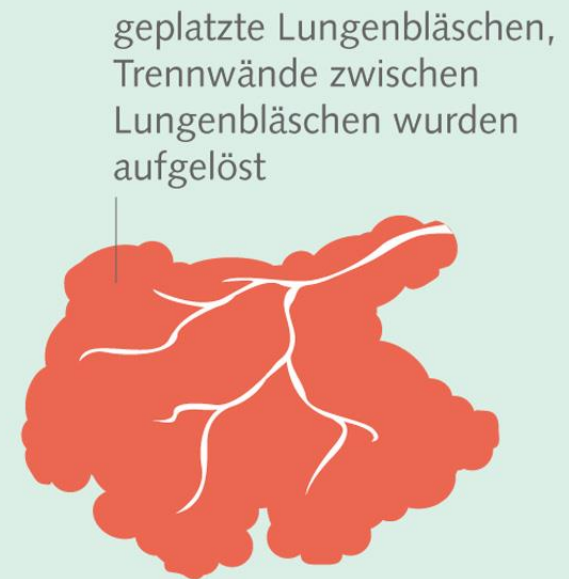
Bereits zerstörtes Lungengewebe im Bereich der Alveolen (Lungenbläschen)